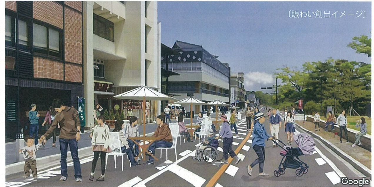
〔賑わい創出イメージ〕